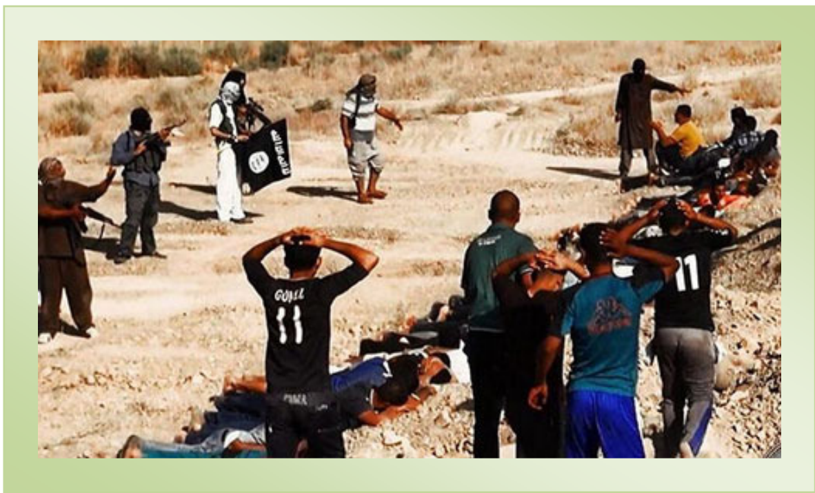
صحنه دیگری از قتلعام دسته جمعی توسط مجاهدین داعش

طبق یک گزارش دیگر آل فیصل در سال 2012 یک کارخانه اسلحه سازی در اوکراین خریداری کرده است. و توسط این شرکت سلاح های سنگین بوسیله طیاره به فرود گاه نظامی در ترکیه منتقل و سپس توسط دستگاه اطلاعات نظامی ترکیه از طریق راه آهن به داعش تحویل داده شده است. و نیز گفته می شود که احتمال این امر که این زنجیره لوژستیک بدون دخالت "ناتو" در جریان باشد، بعید بنظر می رسد. همچنین گفته میشود که در موضوع گروگانگیری (15) تن از دیپلماتهای ترکیه به همراه اعضای خانواده های آنها و (20) تن از کارکنان کنسولگری این کشور در موصل توسط داعش که خشم انقاره را برانگیخت؛ این احتمال وجود دارد که امریکا ترکیه را در این دام انداخته باشد، تا انقاره در این مسیر نتواند سنگ اندازی کند. زیرا نقشه "خاورمیانه بزرگ" که در سال 2006 منتشر شد (در طرح دولت امریکا) بخش اعظمی از خاک ترکیه را نیز شامل میشود. ولی از جهت دیگر داوود اغلو وزیر خارجه ترکیه بتاريخ (25 جون) گفت که: "داعش دشمن ترکیه نیست". و محکومیت داعش در شورای امنیت ملل متحد نیز از جمله شایدها و ریاکاریهای دولت امریکا است.