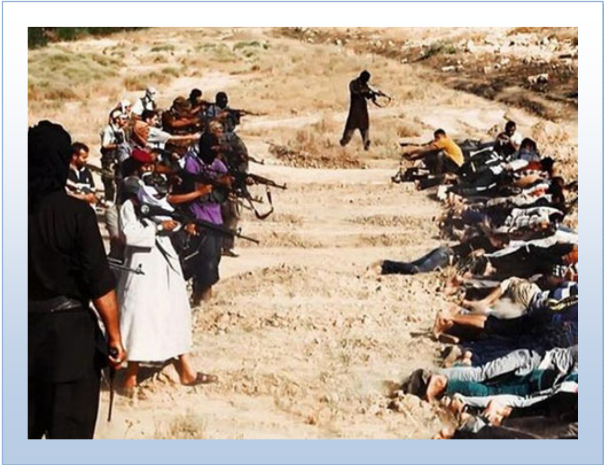
صحنه دیگری از کشتار مردم به دست مجاهدین داعش

همچنین سازمان ملل گزارش داد که در طول ماه جون بیش از دو هزار و پنجاه تن عراقی در اثر اقدامات خشونت آمیز جان های خود را از دست داده اند که هزار و پنجاه تن آنان غیرنظامی بوده اند. طی هفته های اخیر حدود نیم میلیون از اهالی مناطق تحت تصرف داعش از خانه ها و محل شان به منطقه کردستان و یا دیگر شهرهای عراق فرار کرده و در شرایط گرمای بالاتر از (45 درجه سانتی گراد) در دشتهای سوزان عراق در یک شرایط جهانی زندگی میکنند.