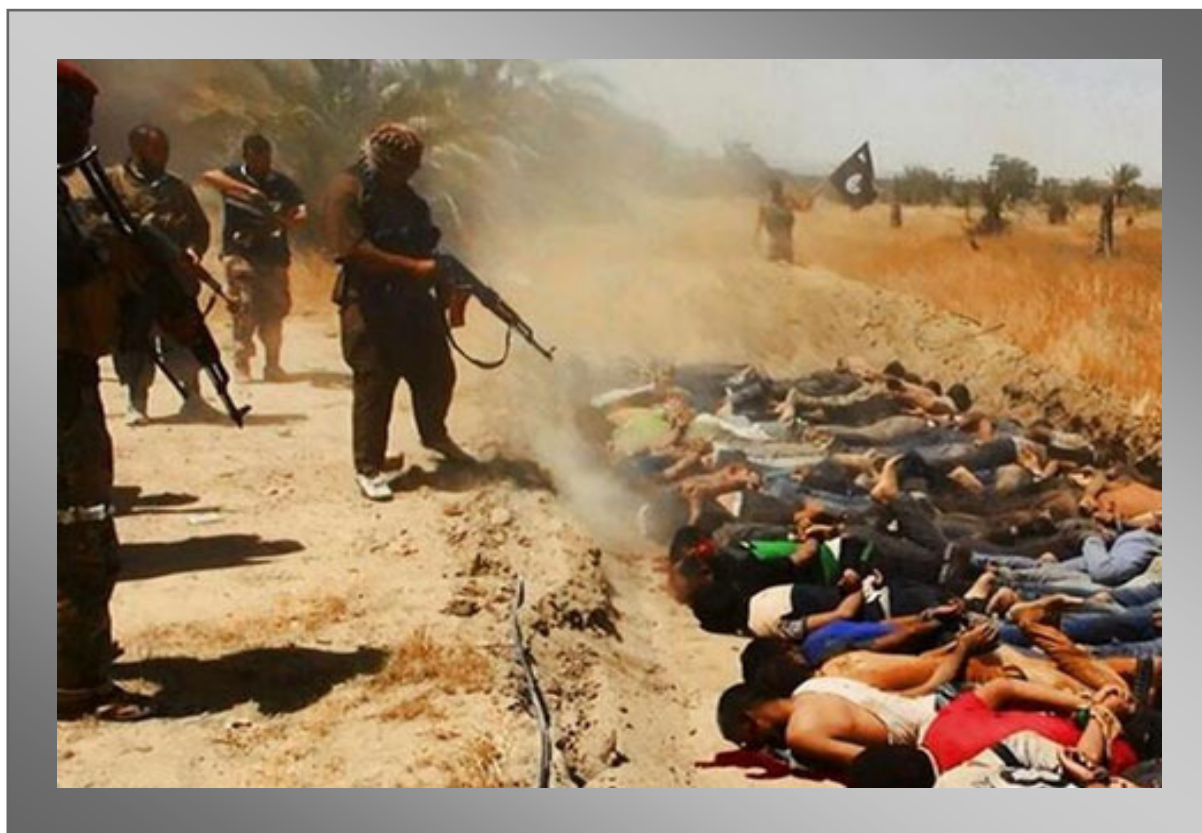
راکه تسلیم شده بودند قتل عام کردند. (یکی از صحنه های قتلعام دانشجویان کالج نظامی عراق بدست داعش)

ارتش و پولیس عراق در این ولایات بدون مقاومت سلاحهای خود را رها کرده و فرار نمودند. همچنین گفته شده که این حمله داعش با اتحاد و همکاری رهبران قبایل سنی، بعضی ها از ولایات انبار، موصل و تکریت (که عزت ابراهیم الدوری معاون سابق صدام حسین این گروه ها را رهبری میکند) صورت گرفته است. ولی در تکریت بعد از فرار نیروهای ارتش و پولیس، پیشمرگه های کرد بخشهای زیادی از شهر تکریت را تصرف کردند و بخش دیگر این ولایت در کنترل داعش است. در ولایت تکریت حدود (900) هزار نفر از کردها، ترکمنها، عربها، آسوریها و کلدانیها زندگی میکنند. بعد از تسلط داعش در این بخش از عراق، اکنون گروه های اسلامی "نقشبندیه"، "الجیش الاسلام"، "گردانهای انقلاب عشرین" و "جیش الانصار" و جریانهای مربوط به حزب بعث عراق، افسران سابق گارد صدام، افسران سازمان اطلاعات صدام و قبایل سنی یکجا با داعش علیه دولت نوری المالکی متحد شده اند. بتاريخ (16) جون شاهدان عینی گزارش دادند که نیروهای داعش زنان ولایت موصل را مجبور به "جهاد نکاح" کرده که برخی از آنها تن به این ننگ نداده و خودکشی را ترجیح داده اند. و نیز گزارش می شود که از آن روز تا کنون زنان زیادی در ولایات تحت کنترل "داعش" از ترس و وحشت تجاوز این وحشیان خودکشی کرده اند. داعش در تمام شهرهای تحت سلطه اش قوانین شرع اسلام را به اجراء گذاشته است و هر کس از انجام "جهاد نکاح" دختران شان با جنایتکاران داعش جلوگیری کند، شدیداً مجازات میکنند. در همین روز گفته شد که نیروهای داعش (1700) تن از محصلین کالج هوایی عراق